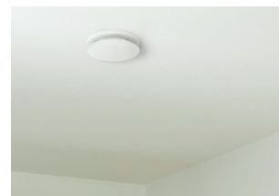
Zehnder ComfoValve Luna E, Deckenmontage