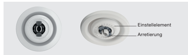
Zehnder ComfoValve Luna E