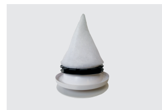
Zehnder ComfoValve Luna E mit Filter