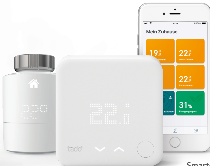
Smarte Thermostate V3+